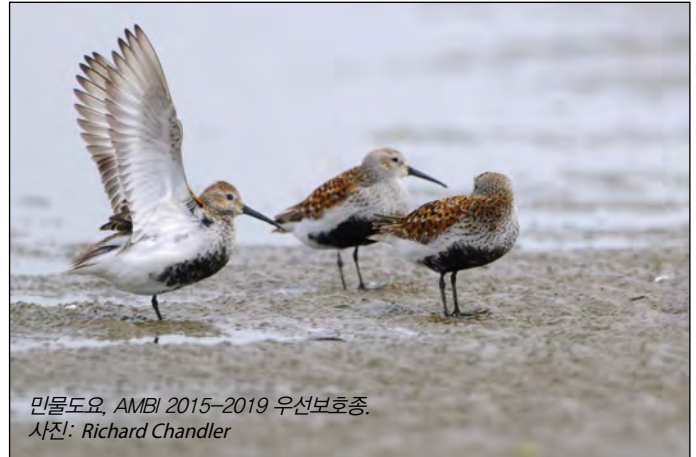
민물도요, AMBI 2015-2019 우선보호종.

북극 철새, 특히 넓적부리도요새, 흰이마기러기, 큰뒷부리도요, 기타 우선보호종의 지속 가능 하지 않은 합법적 포획을 규제하고 불법 포획을 예방