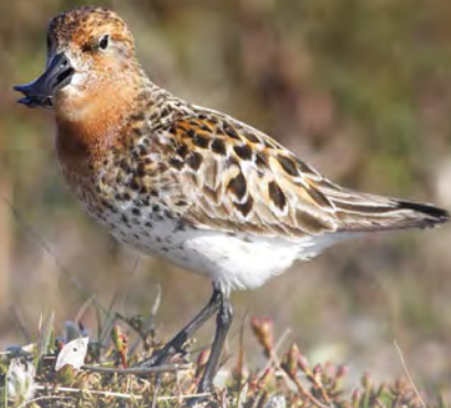
넓적부리도요, 북극 철새 이니셔티브 우선 보호종 2015-2019