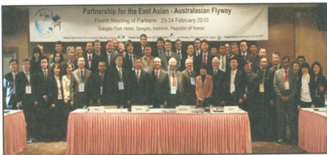
តំណាងដៃគូនៅកិច្ចប្រជុំនៃដៃគូ លើកទី៤ ឆ្នាំ២០១០

ភាគីដៃគូជួបប្រជុំគ្នាម្តងក្នុងមួយឆ្នាំ ដើម្បីរាយការណ៍អំពីការអនុវត្តយុទ្ធសាស្ត្រ ការឆ្លើយតបចំពោះបញ្ហា ដែលកើតមាន និងអាទិភាព ហើយភារកិច្ចអំពីកិច្ចសហប្រតិបត្តិការ នៅពេលអនាគត ។